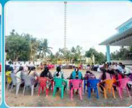
Youth Political Awareness Program at Moolangudi