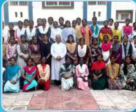
Marriage Preparation Course at Thanjavur