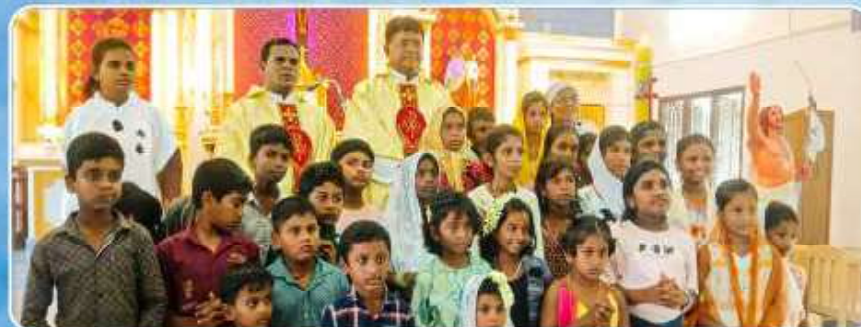
Sunday Catechism Class – Moolangudi