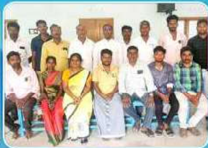
SC/ST Commission Nagapattinam Vicariate Representatives Meeting at Thiruvapur