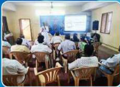
SC/ST Commission Mayiladuturai Vicariate Representatives meeting