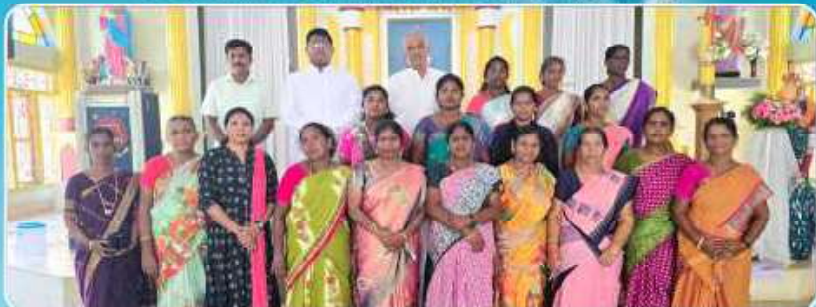
Evangelization Training – Namanasamudram