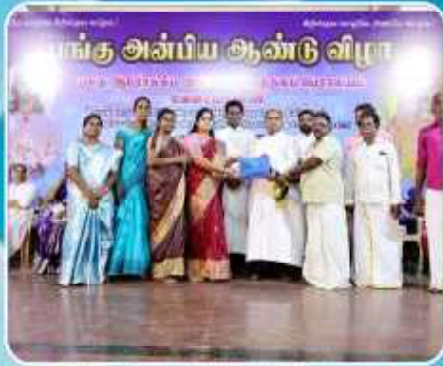
Anbiam Annual Celebration - Vallankanni