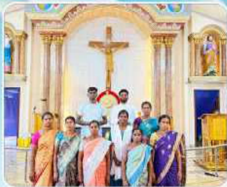
Adoration Shoot at Maraneri