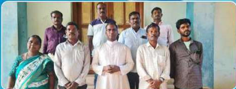
SC/ST Commission Palayamkottai Vicariate Representatives meeting