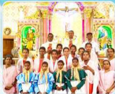
Mass Shoot at Vallispettai Parish