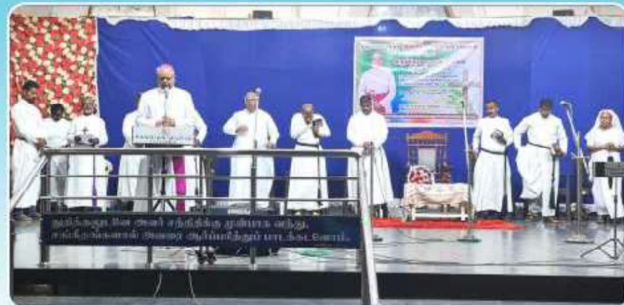
Ecumenical Palm Sunday Prayer service at TELC Thanjavur