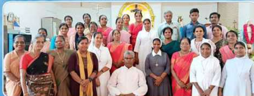
VBS Training Program at Bethsaida-1