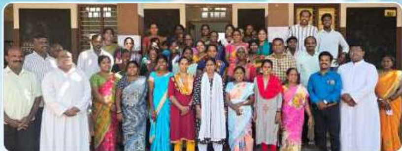
Evangelization Training – Pattukottai