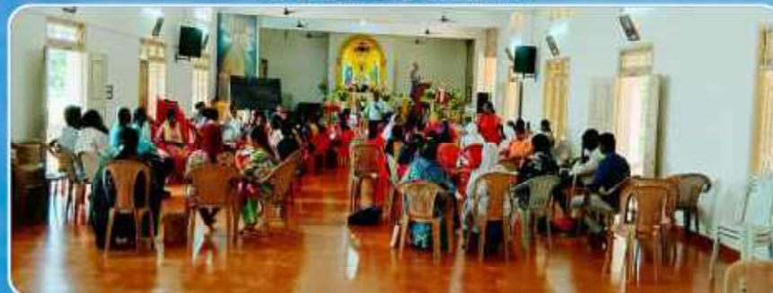
VBS Training Program at Bethsaida-2