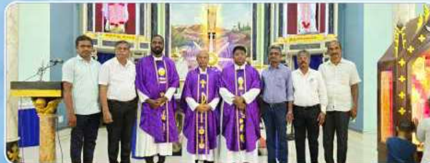
Lenten Retreat at Kalaiyarkovil by our Diocesan Lay Evangelisers