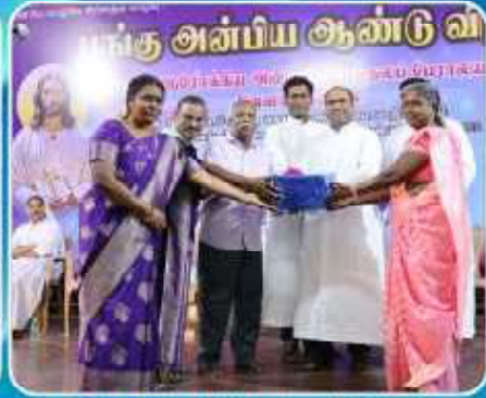
Anbiam Annual Celebration - Vallankanni