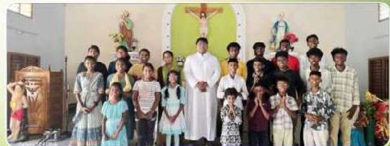
First Communion Class - Vayalur