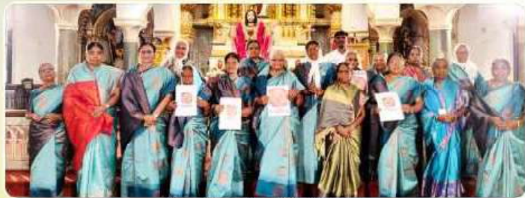
Rosary Shoot – Sacred Heart Cathedral