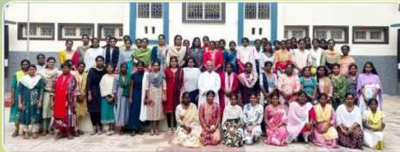
Marriage Preparation Class – Pastoral Centre