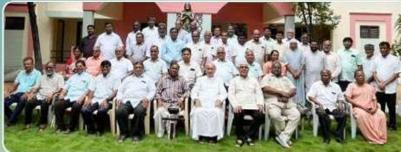
TNBC Pastoral Centre Coordinators and Regional Commission Secretaries Meeting – Tiruchy