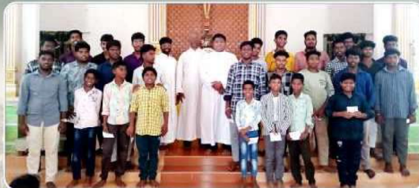
Confirmation Preparation Class - Kuthalam