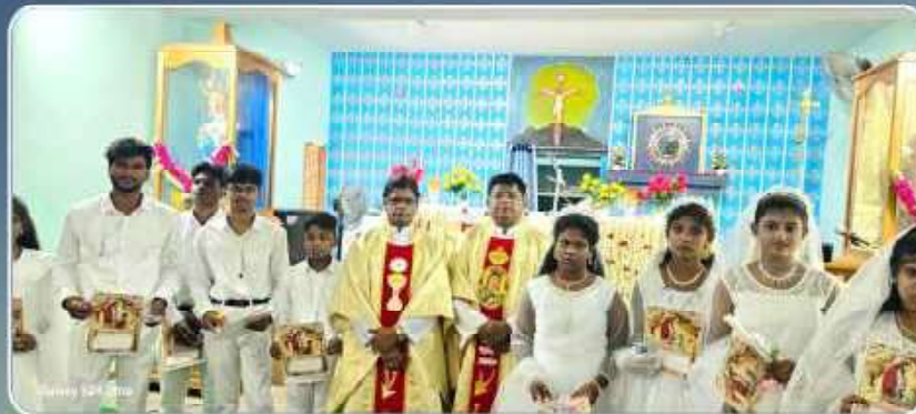
Sacrament of Reconciliation and First Holy Communion - Annaikadu