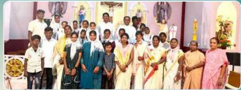
Mass Shoot – Kanur