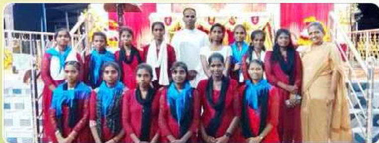
Jesus Youth Adoration Festival – Paruthiyur