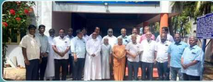
CBCI Synodal Implementation Meeting - Tiruchy