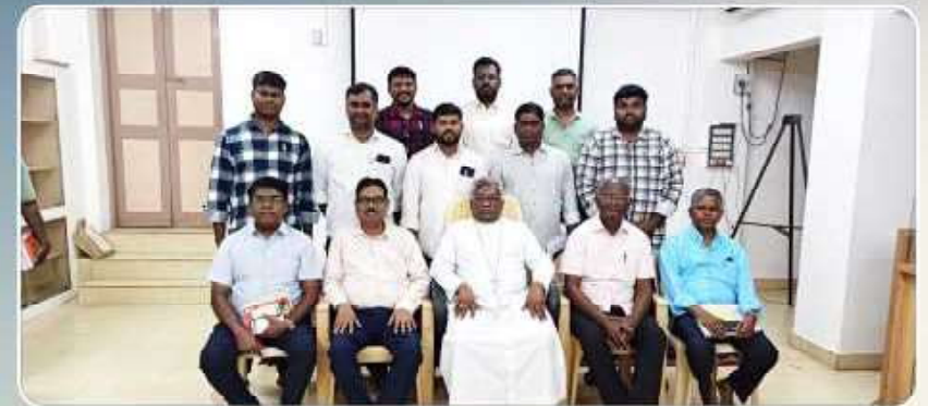
Regional Meeting - SC/ST/BC Commission, Tiruchy