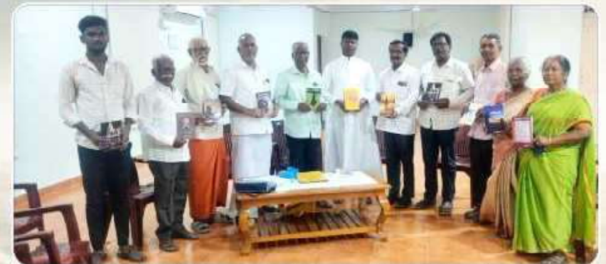
Independence Day Celebration Planning Meeting - Inter Religious Dialogue Commission