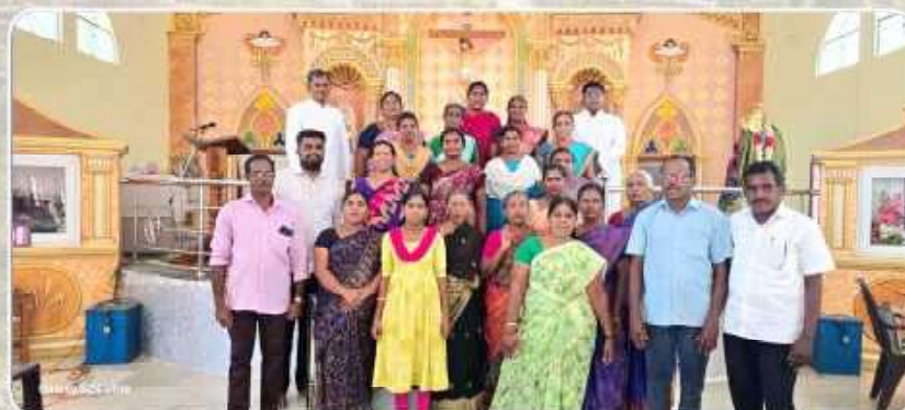
Voluntary Lay Evangelizers training - Kottaikkadu