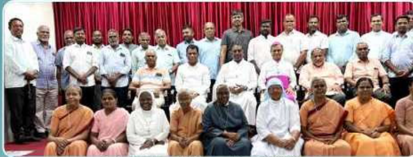
Regional Meeting of Bible Commission – TASOS, Tiruchy