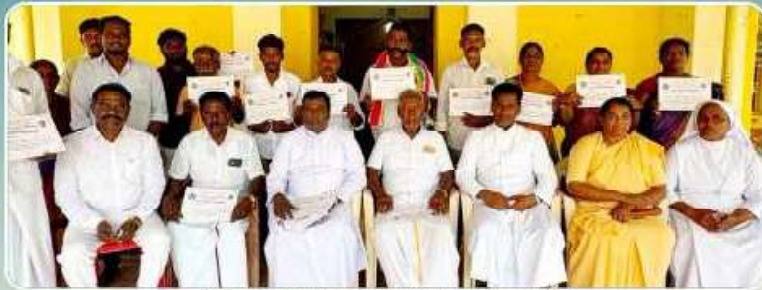
Parish Council Formation & Certification – Vichoor