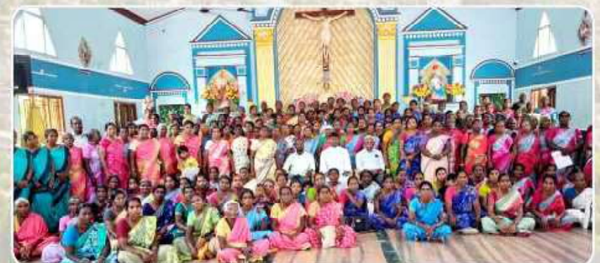
Makkal Mandram Training Program - Palayamkottai