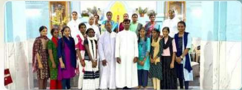
Youth Visit – Munnayampatti