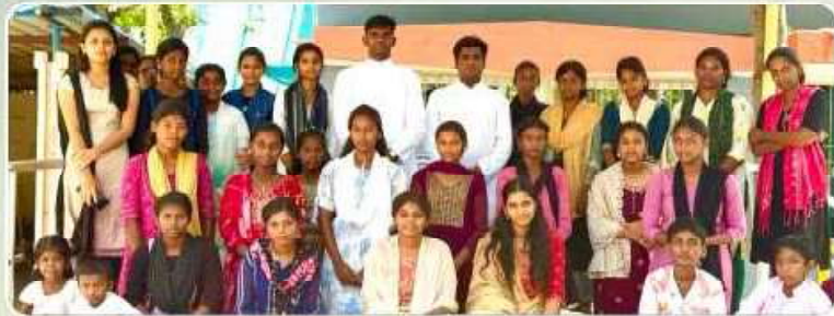
Youth visit – Sirkazhi