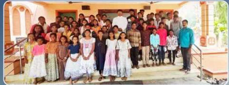
First Holy Communion Class – Budalur