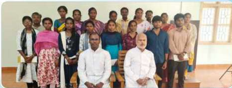
SC/ST-Commission Vicariate Level Special prizes to those who secured the first three places in the 2025 XII Std marks.