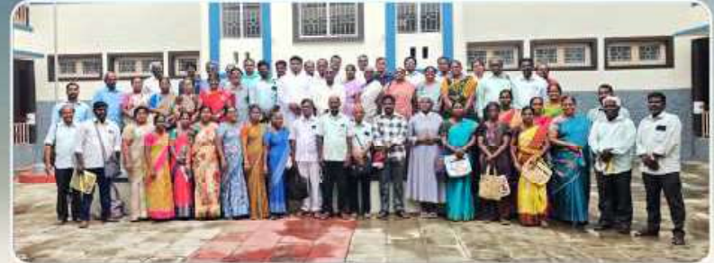
Lay Evangelizers Group Leaders Meet - Pastoral Center