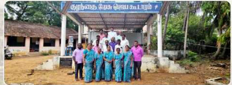
Lay Evangelizers training – Budalur