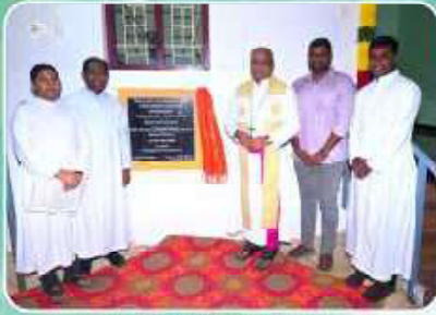
Blessing & opening of New Presbytery of Vayalur Parish at Palliagraharam on 23.05.2026