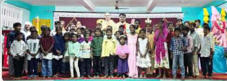
Sunday Catechism Children - Devadanam