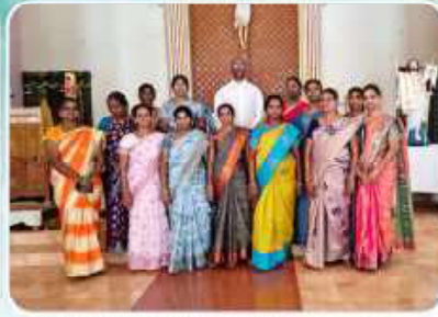
Christian Women's Movement – Kuthalam