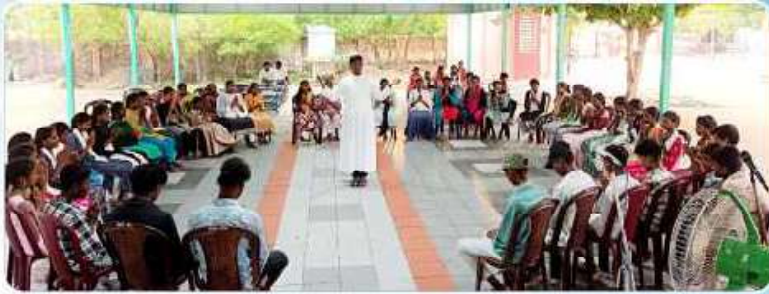
Seminar on Environment at Devadhanam