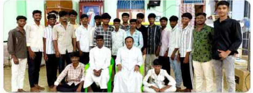
Youth Visit at Mandalakottai