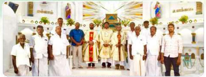
Mass Shoot at Punalvasal Parish