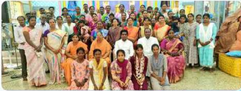
Labour Commission, May Day Celebration at Sirkazhi