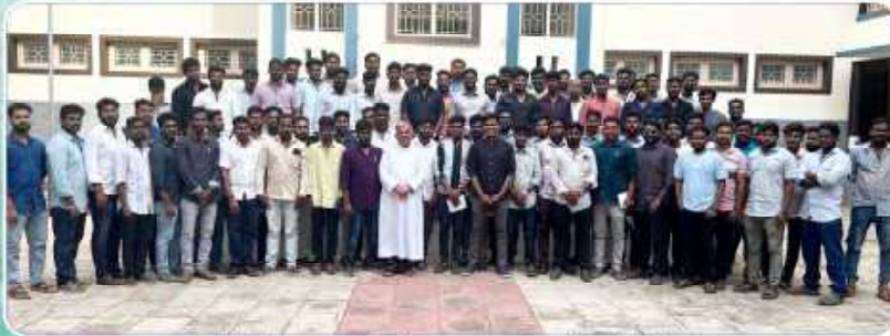
Health care commission secretaries meeting at Trichy