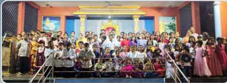
Sunday Catechism and VBS Celebrations - Pudukkottai