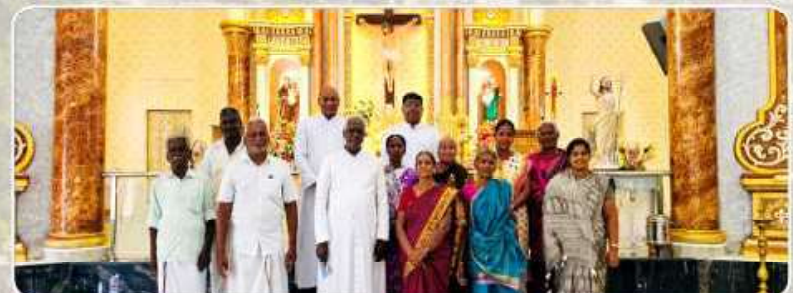
Lay Evangelizers Meet - Arimalam