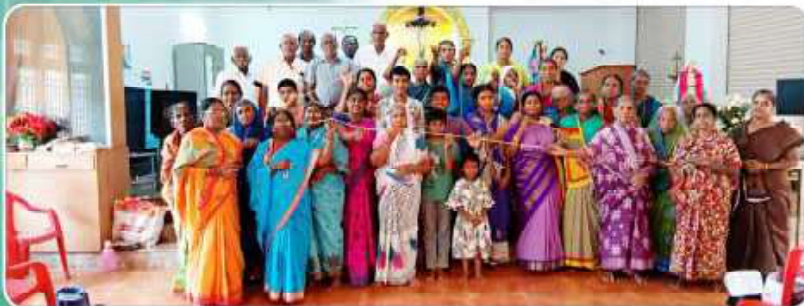
First Saturday Chain Rosary – Bethsaida