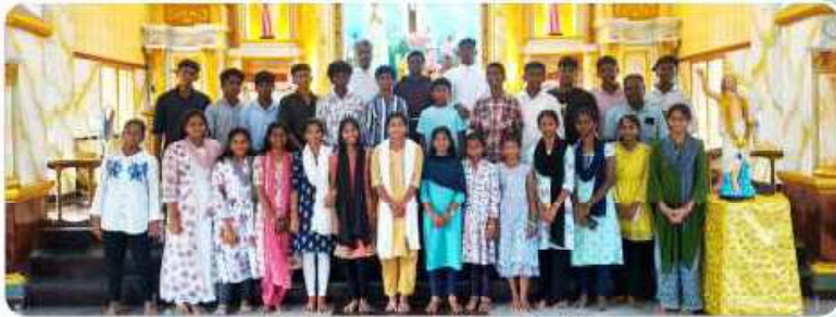
Orientation Program at Thiruvarur Parish