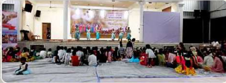
VBS Celebration - Pattukkottai