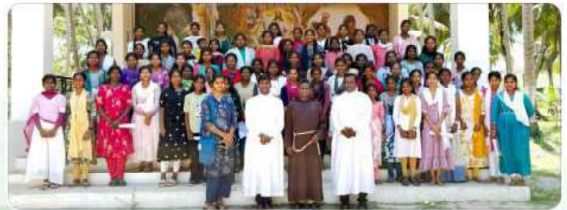
Carrer Guideline Program at Vichoor