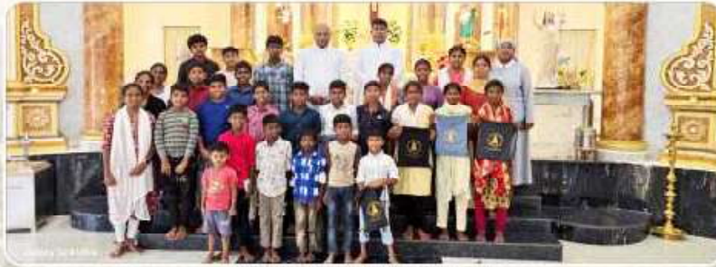
Sunday Catechism Visit - Arimalam