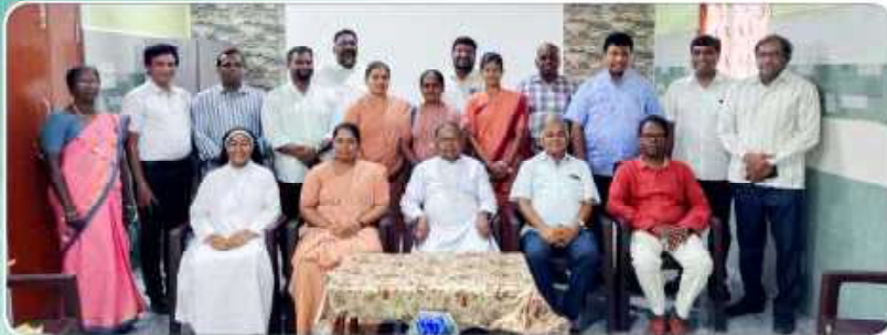
Marriage Preparation Class – Pastoral Centre, Thanjavur